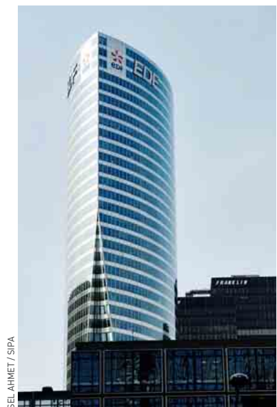
Le CE d'EDF avait été mis à l'index par la Cour des comptes en 2005 et 2007.

De fait, les comités d'entreprise ne sont soumis à aucune obligation de contrôle des comptes, soulignait hier le site d'information économique e24.fr. Tous les ans, les élus du CE doivent arrêter les comptes et les présenter au personnel. Mais il n'existe aucune règle de certification des comptes, ni contrôle officiel du budget. « Le commissaire aux comptes de la société n'a pas le droit d'y mettre son nez, et si beaucoup de comités font appel à des experts-comptables, ils n'y sont pas tenus par la loi », a expliqué au site Internet Frédéric